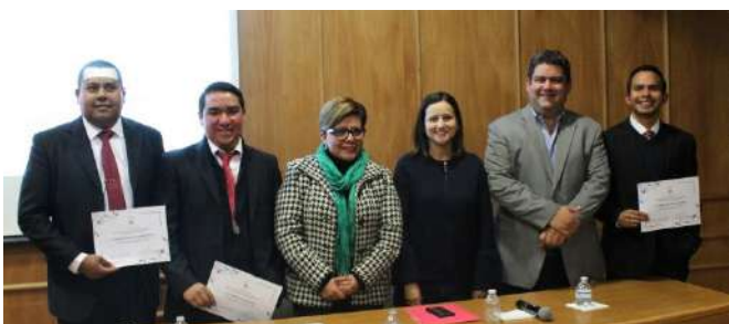
TALLER ANÁLISIS Y RETOS DEL SISTEMA ESTATAL ANTICORRUPCIÓN