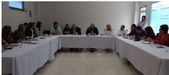
REUNIÓN CON USAID