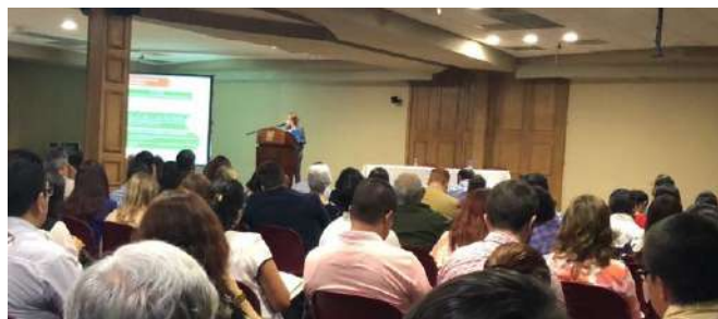
TALLER DE IMPLEMENTACIÓN DEL SISTEMA ESTATAL ANTICORRUPCIÓN