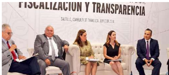
PRIMER SEMINARIO DE VINCULACIÓN DE LOS SISTEMAS NACIONALES ANTICORRUPCIÓN, FISCALIZACIÓN Y TRANSPARENCIA