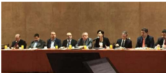
PLÁTICA CON INTEGRANTES DEL CONSEJO COPARMEX REGIÓN SURESTE