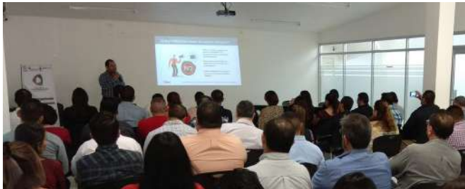
CAPACITACIÓN Y DIFUSIÓN DEL SAEC