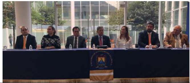
FIRMA DE CARTA COMPROMISO ENTRE LA FEHC Y LA UNIVERSIDAD AUTÓNOMA DE COAHUILA