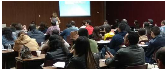
DIPLOMADO ÉTICA PÚBLICA Y CORRUPCIÓN