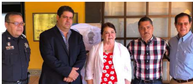
PROGRAMA DE CAPACITACIÓN CONTINUA "PREVENCIÓN DE LA CORRUPCIÓN PARA SERVIDORES PÚBLICOS"