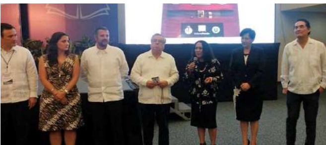
ASISTENCIA AL CONGRESO ELABORACIÓN DE CÓDIGOS DE ÉTICA